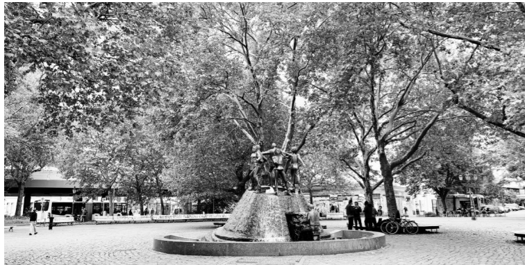
Der Nettelbeckplatz im Wedding wird in Martha-Ndumbe-Platz umbenannt.

Im Januar 2025 beschloss die Bezirksverordnetenversammlung (BVV) Mitte die Umbenennung des Nettelbeckplatzes im Wedding. Künftig soll er den Namen "Martha-Ndumbe-Platz" tragen. Vorausgegangen war ein mehrjähriger Prozess, angestoßen 2021 durch lokale Initiativen und zivilgesellschaftliches Engagement. Der bisherige Namensgeber, Joachim Nettelbeck, war Offizier und aktiver Befürworter des Kolonialismus. Im Jahr 1771 heuerte Nettelbeck in Amsterdam auf einem niederländischen Sklavenschiff als Obersteuermann an. In den folgenden Jahren war er Teil des transatlantischen Dreieckshandels, bei dem versklavte Menschen von der westafrikanischen Küste nach Südamerika verschleppt wurden. Seine Biografie steht für ein rassistisches Erbe, das bis heute städtebaulich sichtbar ist. Die Umbenennung markiert daher nicht nur einen neuen Namen, sondern einen Schritt zur kritischen Auseinandersetzung mit kolonialer Geschichte im Berliner Stadtraum.