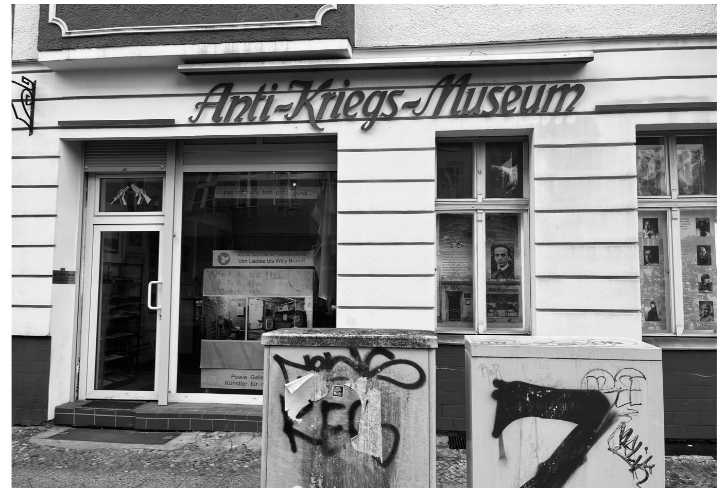
Anti-Kriegs-Museum Brüsseler Str. 21, 13353 Berlin Öffnungszeiten: Montag bis Sonntag 16 bis 20 Uhr Gruppenbesuche planen: 030 45490110 www.anti-kriegs-museum.de