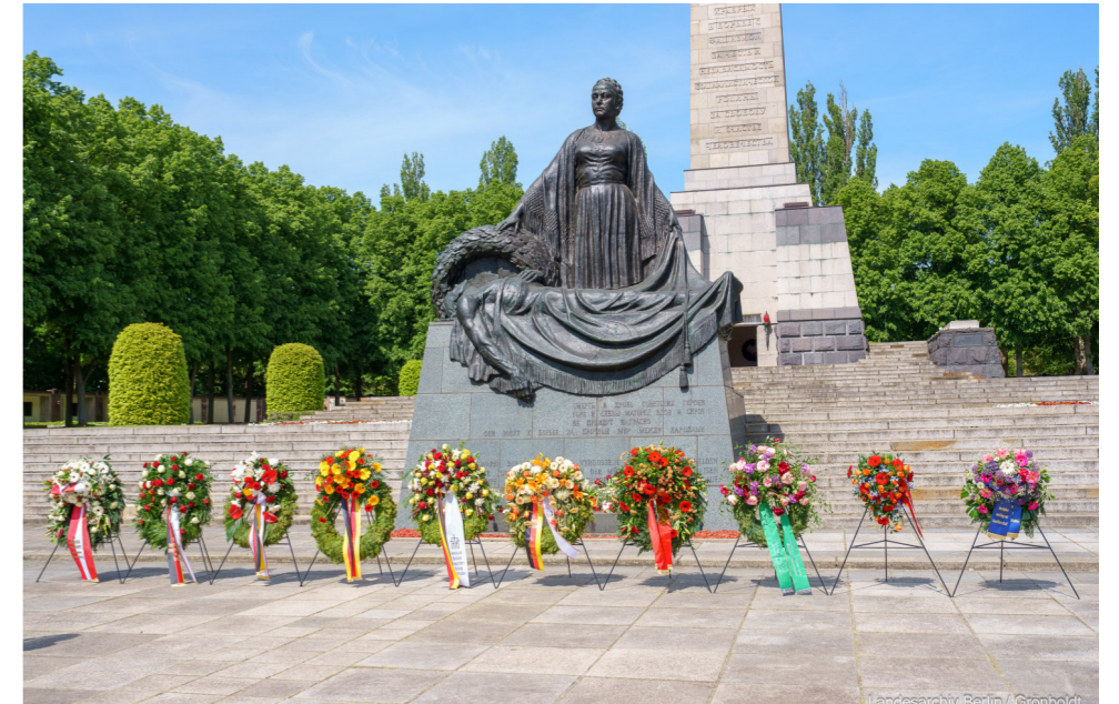
Sowjetische Ehrenmal in der Schönholzer Heide

Dass die AfD dieses Schauspiel aufführen darf, ist ein Schlag ins Gesicht für alle, die sich an die Schrecken der NS-Herrschaft erinnern wollen. Es zeigt, wie verlogen die deutsche „Erinnerungskultur“ ist. Diese Kultur versucht, den Faschismus in der deutschen Nachkriegsgesell-