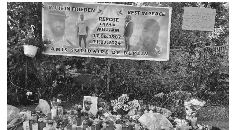
Auf der Böttgerstraße richten Initiativen einen Gedenkort ein