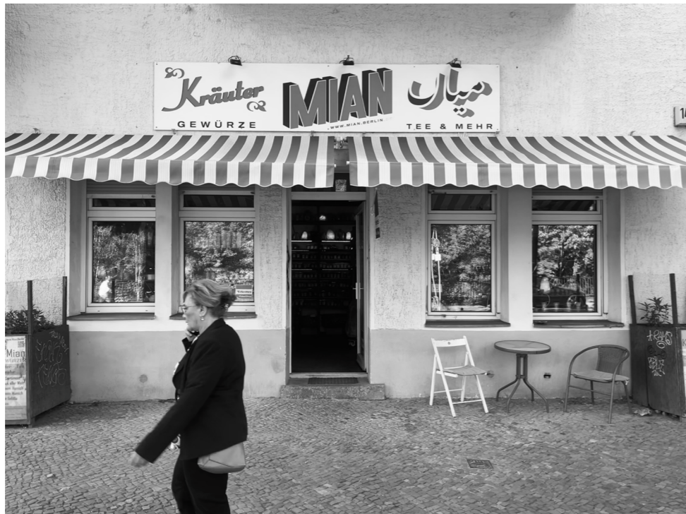
Der Laden Kräuter-Mian am Humboldthain

Ich komme vom Land, deshalb bin ich schon immer naturverbunden gewesen. Es ist toll, hier mit all diesen Kräutern zu arbeiten, sich mit der Herkunft zu beschäftigen und mit der Kultur, die diese Kräuter schon so lange umgibt.