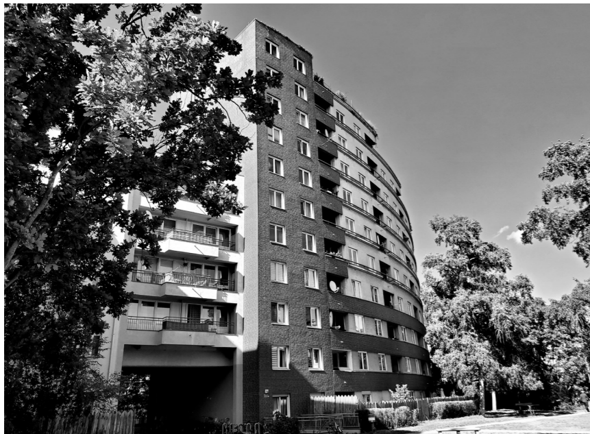
Die Koloniestraße 6b. Probleme mit der Hausverwaltung Grand City Property sind hier an der Tagesordnung.

Die Nachbar*innen der Koloniestraße haben genug von den Zumutungen ihrer Hausverwaltung. Ihr erstes Ziel ist es, möglichst viele Mieter*innen dabei zu unterstützen, zu viel gezahltes Geld zurückzuholen. Niemand soll sich mehr allein durch den Formular-Dschungel kämpfen oder Einschüchterungsversuchen ausgesetzt sein müssen. Doch dabei soll es nicht bleiben. Langfristig fordern sie die Abschaffung des teuren und überflüssigen Sicherheitsdienstes sowie eine grundlegende Verbesserung ihrer Wohnsituation. Dazu gehört auch der Aufbau einer solidarischen und handlungsfähigen Hausgemeinschaft: „Durch das gemeinsame Handeln fühlt man sich nicht so ohnmächtig. Außerdem kann man sich besser gegenseitig motivieren. Alleine wäre dieser Kampf nicht möglich“, erklärt ein Nachbar. So wächst das nachbarschaftliche Miteinander weiter: Zusammen organisieren sie Treffen, teilen Erfahrungen und entwickeln gemeinsame Strategien. Auch wenn der Weg mühsam ist und manche Nachbar*innen diesen Kampf bereits seit über zehn Jahren führen, ist eines klar: Gemeinsam lässt sich mehr erreichen als allein. Der Weg ist lang, aber die Richtung stimmt. ☆