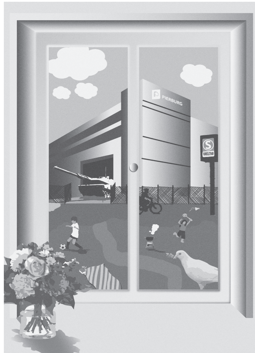
Keine Waffenproduktion in unserer Nachbarschaft!

» Menschen im Wedding haben Familien, Freund*innen, Bekannte in Kriegsgebieten dieser Welt: Das ist sicher. Am Ende töten die Kugeln aus dem Wedding die Geliebten von uns oder unseren Nachbar*innen.«