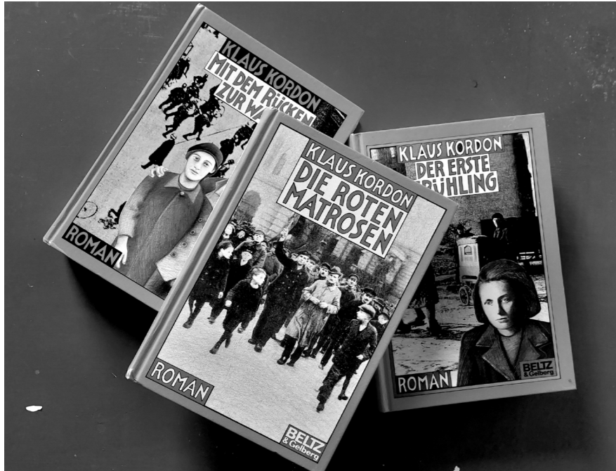
Die Trilogie von Klaus Kordon spielt im Wedding

Von: Kommission Bildung & Geschichte des Stadtteilkomitee Wedding