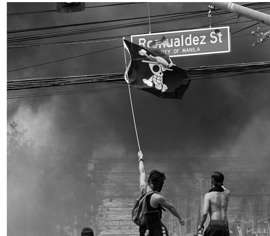
Unter der „One-Piece“-Flagge – das Symbol eines nach Freiheit strebenden Piraten aus einem Anime – sammelten sich viele Proteste

Wer die globale Ebene ausblendet, verkennt daher die Ursachen und Grenzen der aktuellen Aufstände. Zwar könnten einzelne Bewegungen progressive Reformen durchsetzen. Doch die grundlegenden Probleme lassen sich nicht innerhalb eines Wirtschaftssystems lösen, das auf Abhängigkeit, Ausbeutung und Ungleichheit beruht. Der globale Kapitalismus braucht Verlierer. ☆