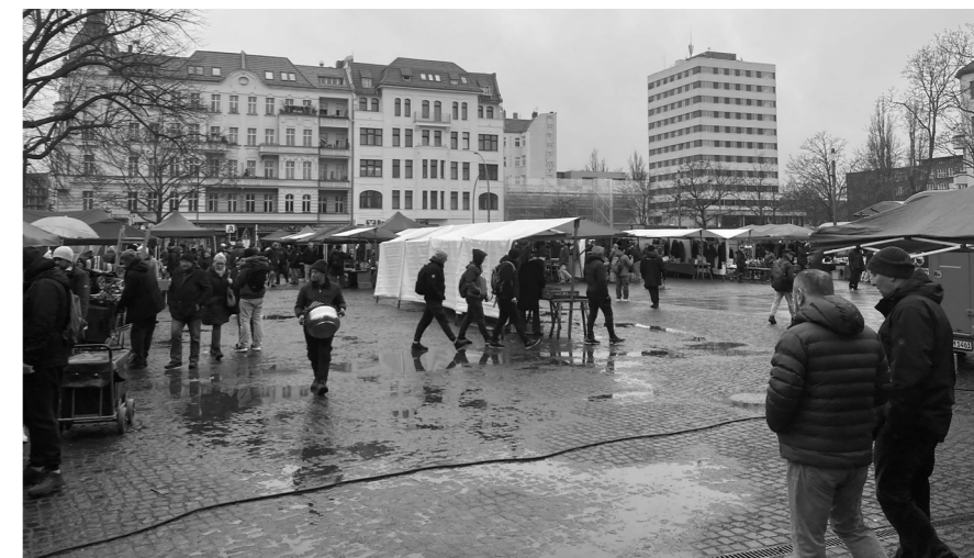
Beliebter Treffpunkt im Kiez: Der Leo-Flohmarkt