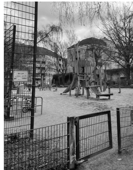
Der Eulerspielplatz, kurz Euler genannt

Konntest Du dich mit den Orten identifizieren? Falls dir das noch nicht genug war, dann schau doch nochmal auf der Seite 14 vorbei, da stellen wir den Gaming-Spāti auf der Osloer Straße vor. ☆