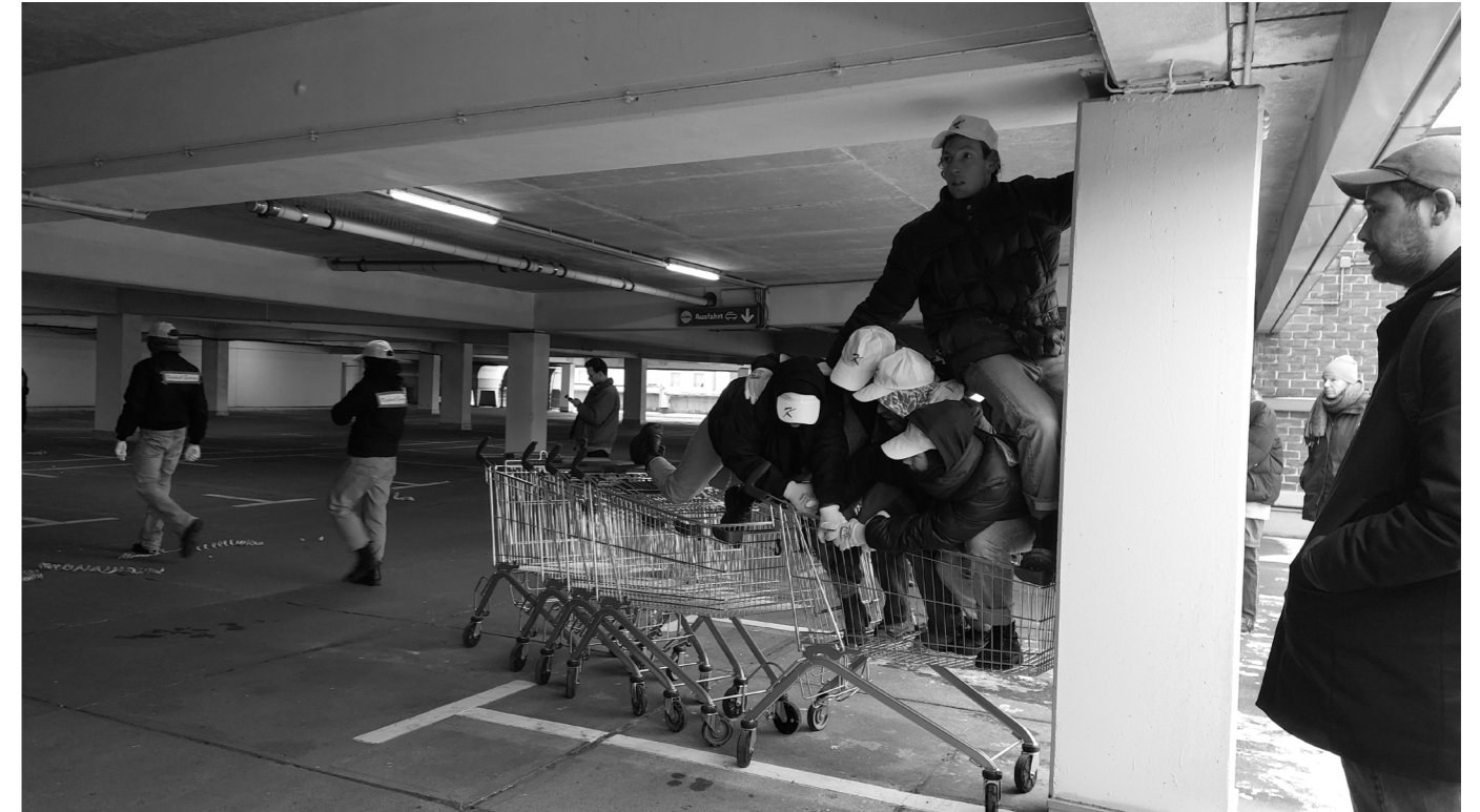
Bei der Performance „Rollende Positionen“ stellten Künstler*innen auf dem Parkdeck vom Karstadt Ende Januar szenisch die Verhandlungsgeschichte um das leerstehende Karstadt-Gebäude dar

Vor genau zwei Jahren, am 31. Januar 2024, wurde der Betrieb des Weddinger Karstadts eingestellt. Das Gebäude stand bis zum vorübergehenden Einzug einer Lidl-Filiale ins Erdgeschoss leer. Langfristige Nutzungspläne gibt es bis heute nicht. Vor der Schließung führte das Bezirksamt Mitte gemeinsam mit dem ehemaligen Eigentümer eine Meinungsbefragung durch. Sie zeigte, dass die Anwohnenden soziale