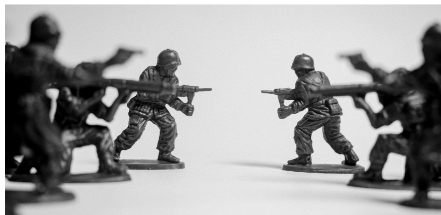
Fit für den Krieg: In den Kinderzimmern fängt es an

Ich würde auf jeden Fall sagen, dass bei vielen, die auch Politik oder Geschichte unterrichten, diese Vorstellung vorherrscht, dass der Westen bestimmte Werte verteidigt und dass es Arten von gerechten Krieg gibt – und andere, die nicht gerecht sind. Und ich glau-