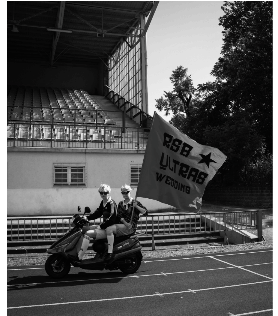
Aktive Fankultur beim Roten Stern

Auch diesen Sonntag zuckt die D-Jugend auf dem Nachbarplatz kurz zusammen, als die RSB-Ultras mit 140-Dezibel das Siegtor jubeln. Diesmal aber ohne Bengalos – die Pyro-Geldstrafe vom letzten